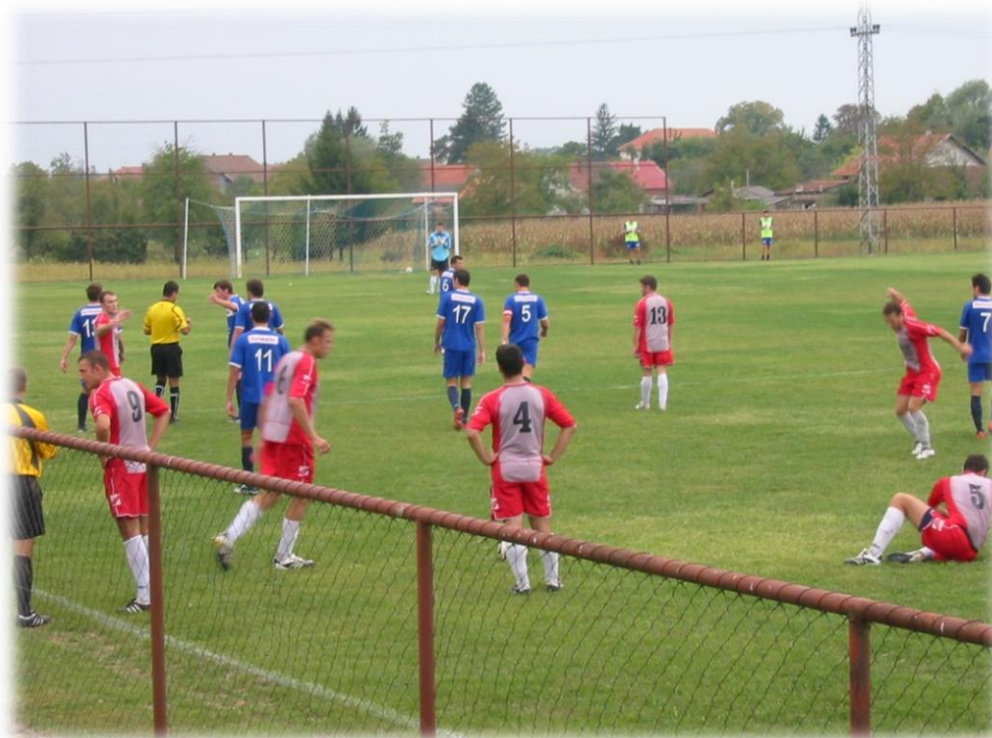
Slika 1. Nogometno igralište Tratinčica